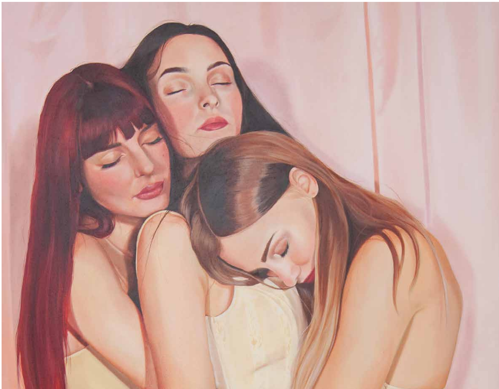
Rosanna Cafarella, Tu c'eri, ci sei e ci sarai (particolare) , 2024, olio su tela