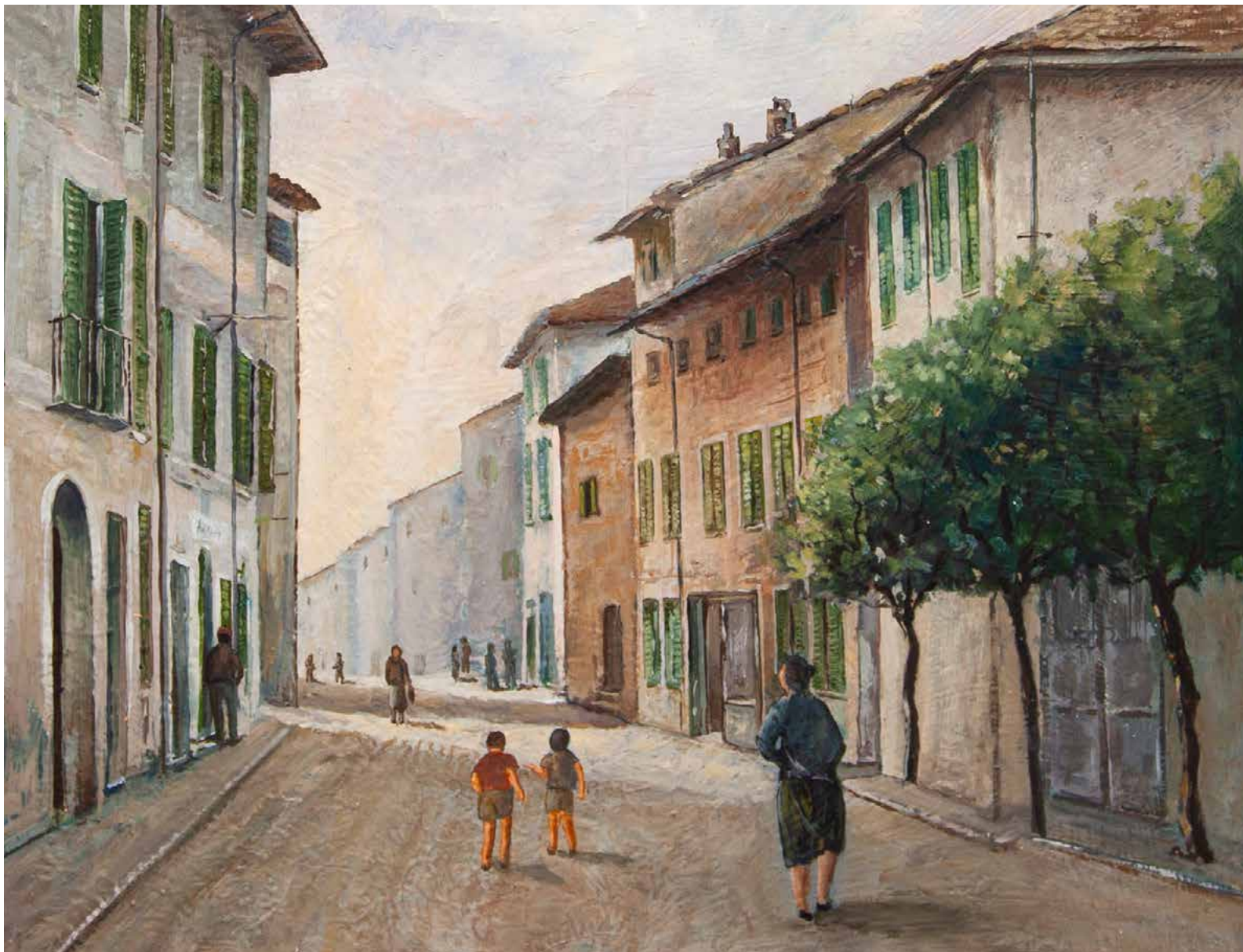
Lorenzo Perna, Turate (particolare) , 2024, olio su tela

01 VEN 02 SAB 03 DOM 04 LUN 05 MAR 06 MER 07 GIO 08 VEN 09 SAB 10 DOM 11 LUN 12 MAR 13 MER 14 GIO 15 VEN 16 SAB 17 DOM 18 LUN 19 MAR 20 MER 21 GIO 22 VEN 23 SAB 24 DOM 25 LUN 26 MAR 27 MER 28 GIO 29 VEN 30 SAB 31 DOM