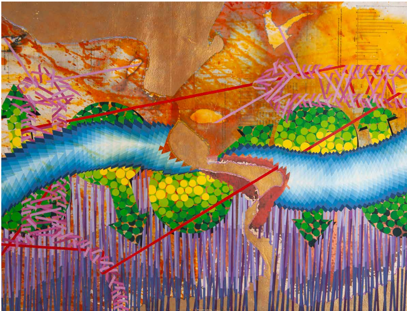
Massimo Carnelli, Senza titolo , 2006, acrilico

01 DOM 02 LUN 03 MAR 04 MER 05 GIO 06 VEN 07 SAB 08 DOM 09 LUN 10 MAR 11 MER 12 GIO 13 VEN 14 SAB 15 DOM 16 LUN 17 MAR 18 MER 19 GIO 20 VEN 21 SAB 22 DOM 23 LUN 24 MAR 25 MER 26 GIO 27 VEN 28 SAB 29 DOM 30 LUN