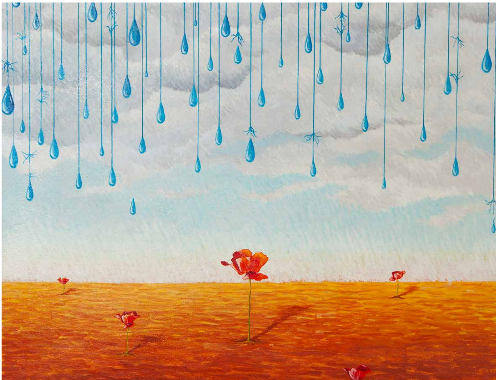
Aldo Sartorelli, Le gocce della vita , 1999, olio su tela