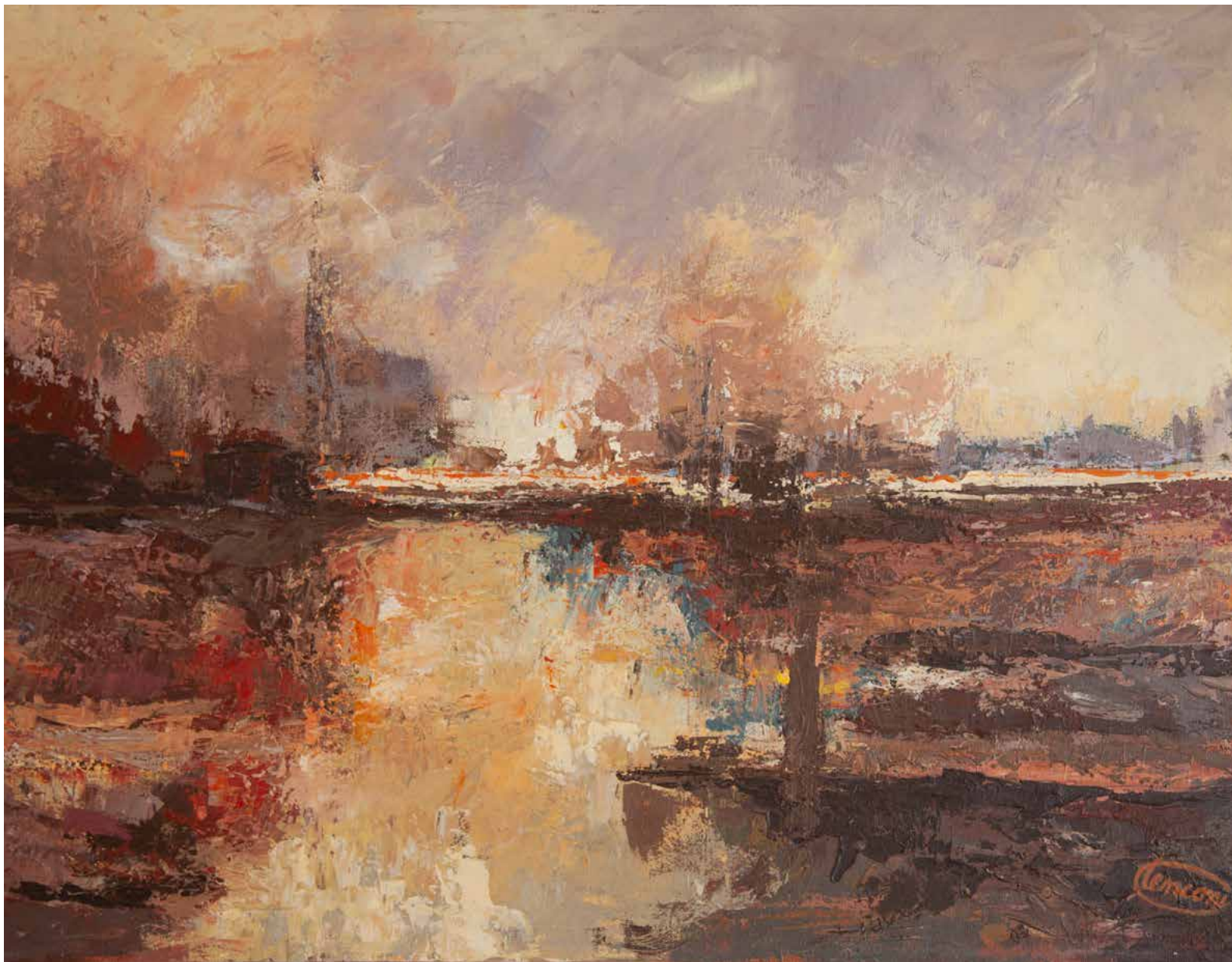
Antonio Tenconi, Luci sull'acqua , 2008, olio su acrilico

01 DOM 02 LUN 03 MAR 04 MER 05 GIO 06 VEN 07 SAB 08 DOM 09 LUN 10 MAR 11 MER 12 GIO 13 VEN 14 SAB 15 DOM 16 LUN 17 MAR 18 MER 19 GIO 20 VEN 21 SAB 22 DOM 23 LUN 24 MAR 25 MER 26 GIO 27 VEN 28 SAB 29 DOM 30 LUN 31 MAR