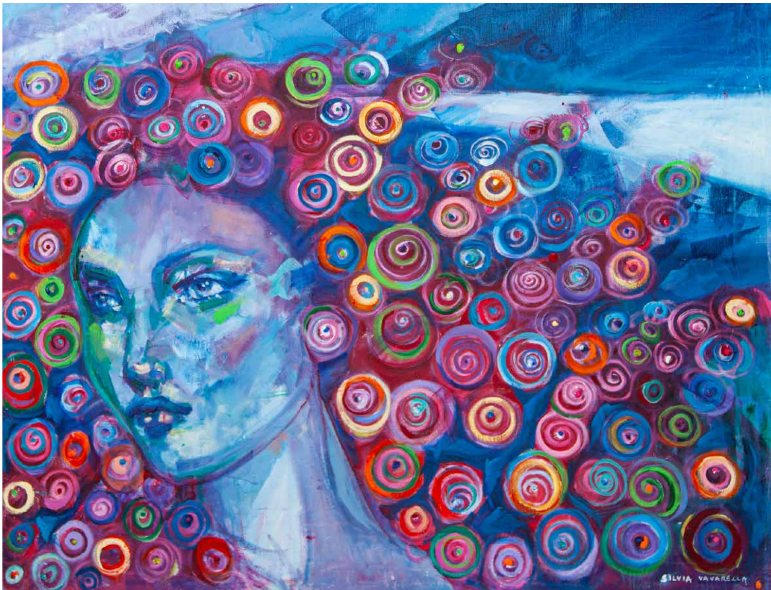
Silvia Vavarella, Sensazioni , 2024, tecnica mista: olio e acrilico