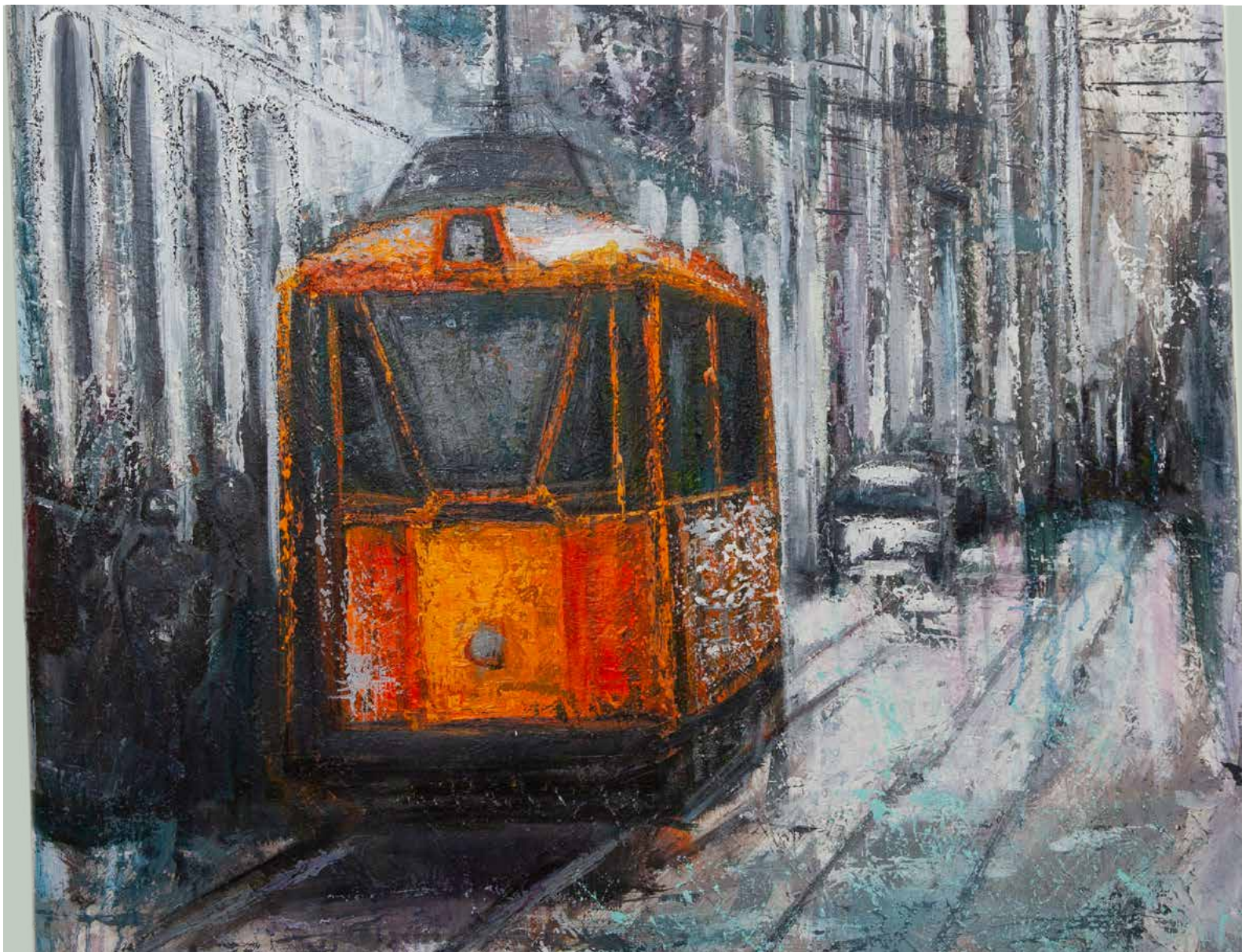
Ermes Ubaldi, Milano tram 1986 , 2017, olio su tela