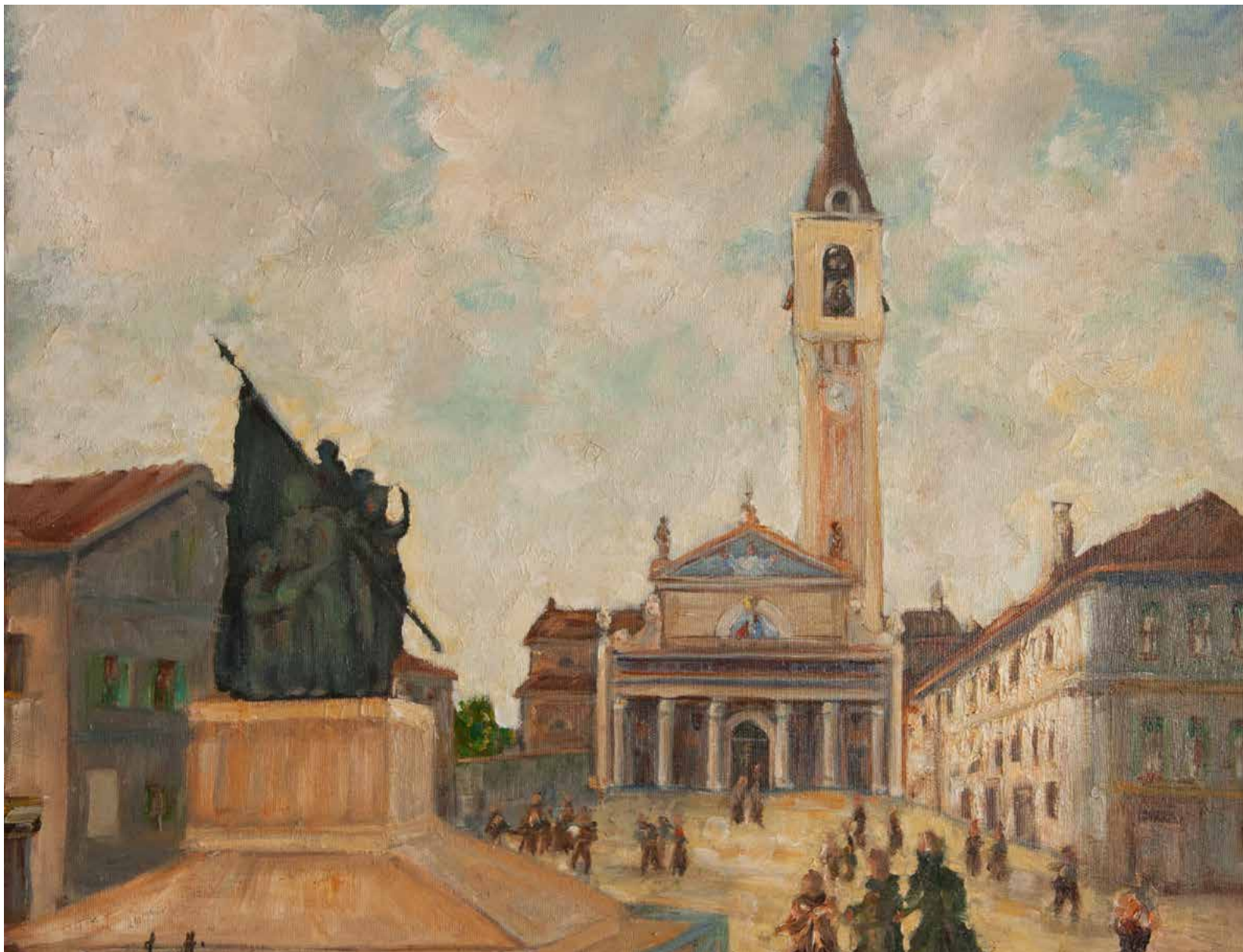
Mario Fusetti, Piazza Volta , 1998, olio su tela

01 SAB 02 DOM 03 LUN 04 MAR 05 MER 06 GIO 07 VEN 08 SAB 09 DOM 10 LUN 11 MAR 12 MER 13 GIO 14 VEN 15 SAB 16 DOM 17 LUN 18 MAR 19 MER 20 GIO 21 VEN 22 SAB 23 DOM 24 LUN 25 MAR 26 MER 27 GIO 28 VEN 29 SAB 30 DOM