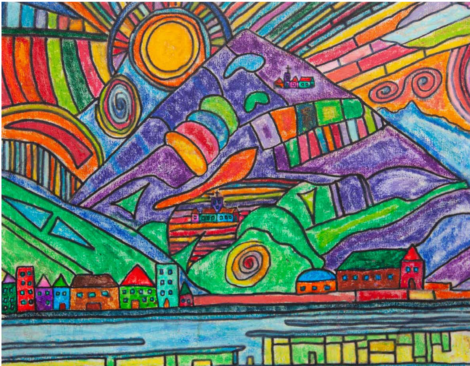
Gabriele Galli, Mountain , 1988, olio su tela

01 MER 02 GIO 03 VEN 04 SAB 05 DOM 06 LUN 07 MAR 08 MER 09 GIO 10 VEN 11 SAB 12 DOM 13 LUN 14 MAR 15 MER 16 GIO 17 VEN 18 SAB 19 DOM 20 LUN 21 MAR 22 MER 23 GIO 24 VEN 25 SAB 26 DOM 27 LUN 28 MAR 29 MER 30 GIO 31 VEN