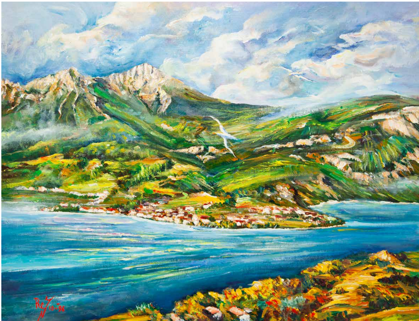
Renato Fusetti, Monti Lariani , 1996, olio e acrilico

01 SAB 02 DOM 03 LUN 04 MAR 05 MER 06 GIO 07 VEN 08 SAB 09 DOM 10 LUN 11 MAR 12 MER 13 GIO 14 VEN 15 SAB 16 DOM 17 LUN 18 MAR 19 MER 20 GIO 21 VEN 22 SAB 23 DOM 24 LUN 25 MAR 26 MER 27 GIO 28 VEN 29 SAB 30 DOM 31 LUN