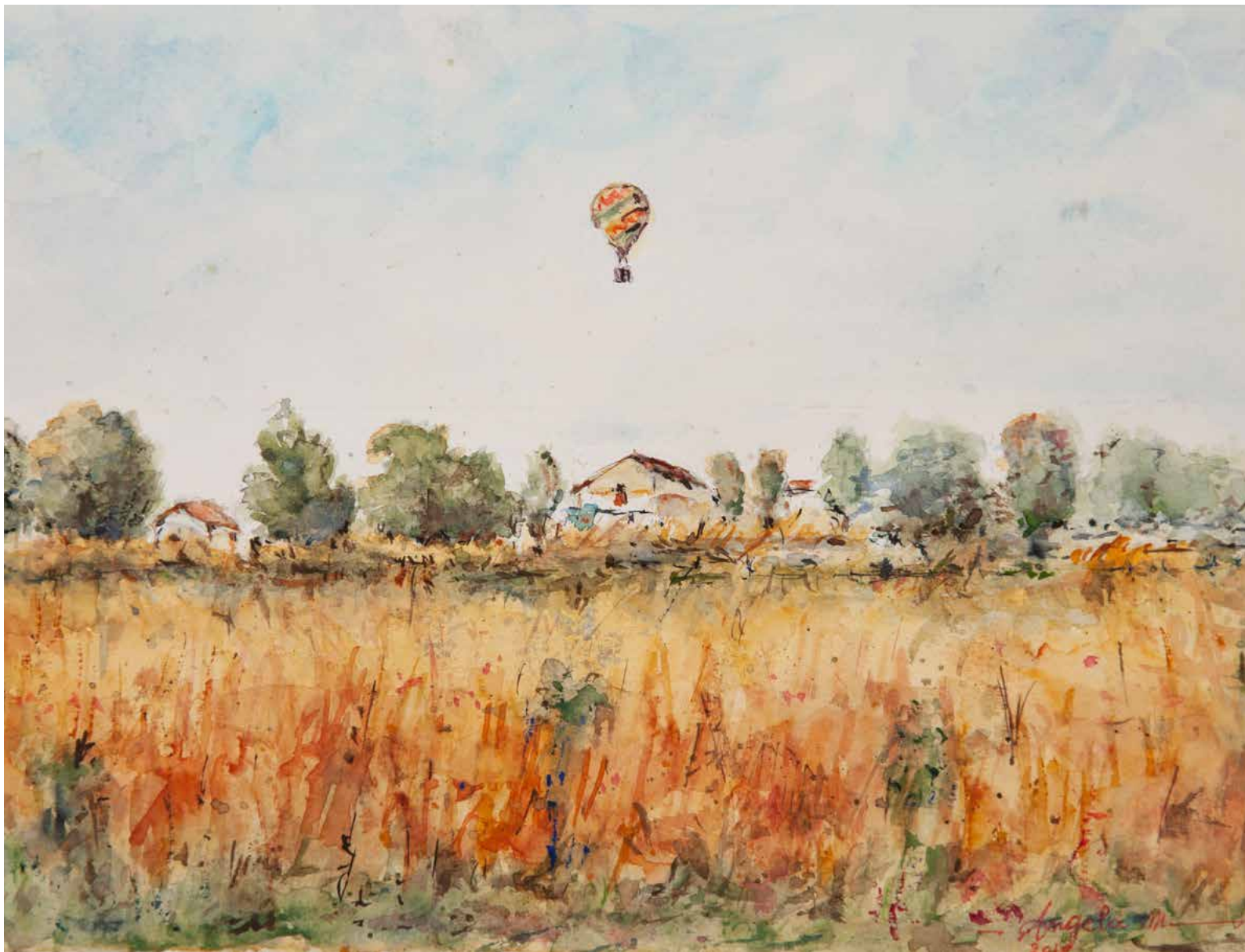
Angela Manfré, Scorci di viaggio , acquerello